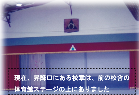
現在、昇降口にある校章は、前の校舎の体育館ステージの上にあります

式辞では昔の校舎の写真などを使って、昔と今を比較しながら150年という歴史の長さを振り返りました。また、校歌は創立当時からあったものではないこと、現在歌われている校歌は、昭和34年に器楽用に編曲されたものであることにも触れました。それ以前の校歌も紹介しましたので、お子さんのご家庭でも話題にさせていただけると幸いです。そして、長い歴史と伝統をもつ小国小学校に誇りをもち、小国小学校を愛する子どもたちに育ててほしいと思っています。