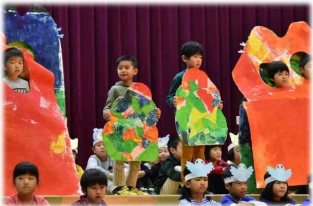
1年生の音読「けんかした山」・・・国語で勉強したことを生かして、たいへん堂々と力強く音読することができました。