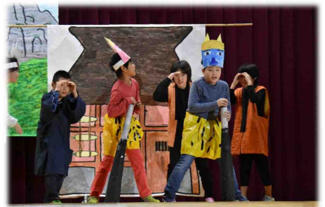
4年生の劇「泣いたあかおに」・・・笑いを誘う場面も入れながら、見る人を引きつける演技がすばらしかったです。