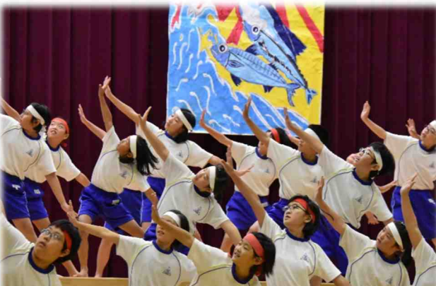
5年生の群読と踊り「農林水産・賞・唱・SHOW」・・・心ひとつに堂々と力強く、全員の呼吸がぴったり合った発表でした。