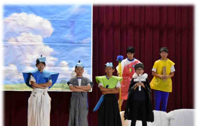
6年生の劇「雲の上の偉人達」・・・6年生全員が協力して、自分たちで創り上げた「全員主役」の劇になりました。