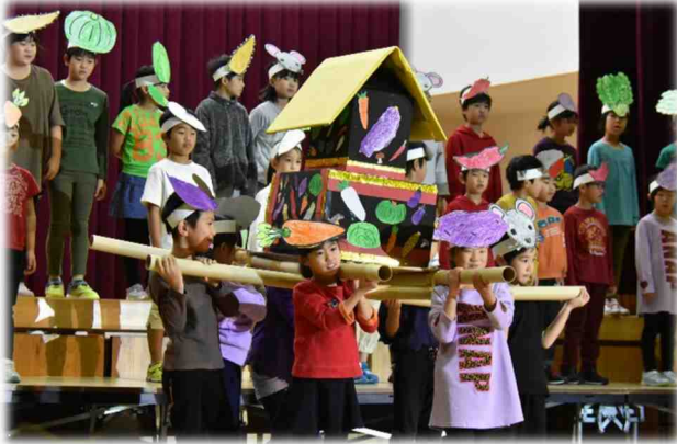
2年生の劇「やさいたちの秋まつり」・・・一番最初の発表でしたが、とても大きな声で楽しく演じていました。

10月20日（土）に、たくさんの地域の方々 と保護者の皆様にお集まりいただいて学習発表会 が行われ、1年生から6年生まで、各学年の発達段階に合わせた「その学年らしい」発表が披露され ました。みんな張りのある大きな声でセリフを言ったり堂々と踊ったりして、とても感動的でした。