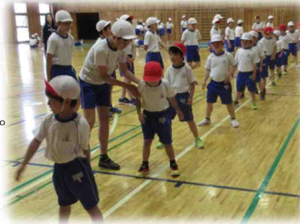
一年生の体力テストのお手伝いをする六年生

子どもたちの生活ぶりを見て、何よりもうれしいのは、高学年の子どもたちが下級生のお世話をする姿がたくさん見られることです。給食準備のお手伝いをしたり、掃除の仕方を教えてあげたり、昼休みにいっしょに遊んだりしています。これも「おぐにっ子」の良さの1つですので続けてほしいと思っています。