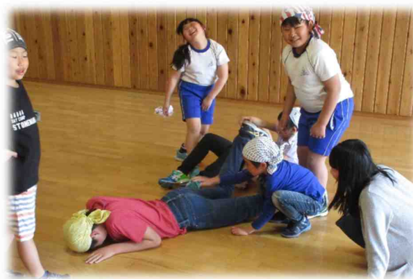
仲よし昼休みは縦割り班で遊びます。「大根抜き」?