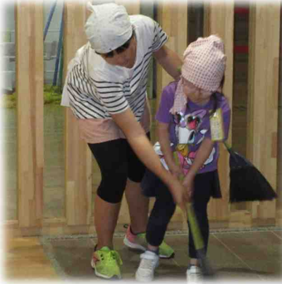
「ほうきはこう持って…」実際に手を取って教えます