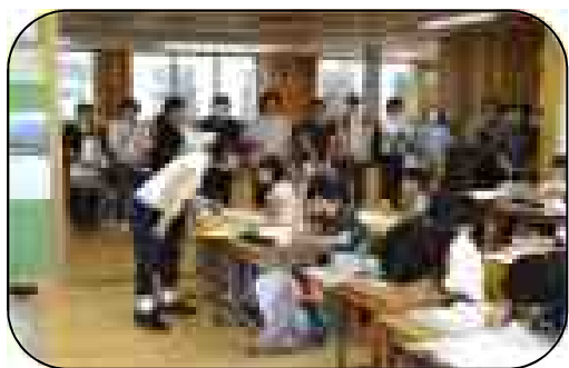
たくさんの保護者に見ていただきました