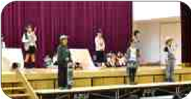
4年 劇「本当の宝物は」