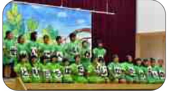
2年 劇「あいうえおのき」

大勢の人の前で自分を表現できたことは、一人一人の大きな自信となり、今後の学校生活に活かされると思います。家庭でも一緒に練習したり、励ましたりしていただいたと思います。ありがとうございました。