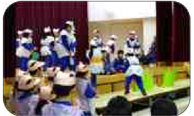
3年 英語劇「おむすびころりん」