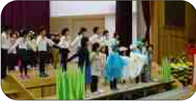
1年 歌と演奏「元気いっぱい なかよし1年生」