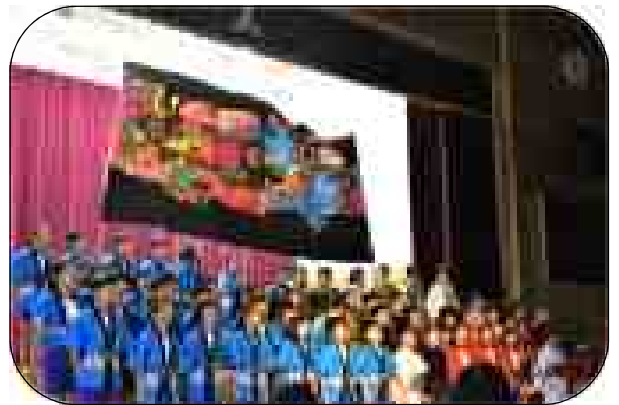
5年 群読「祭りだ わっしょい!!」