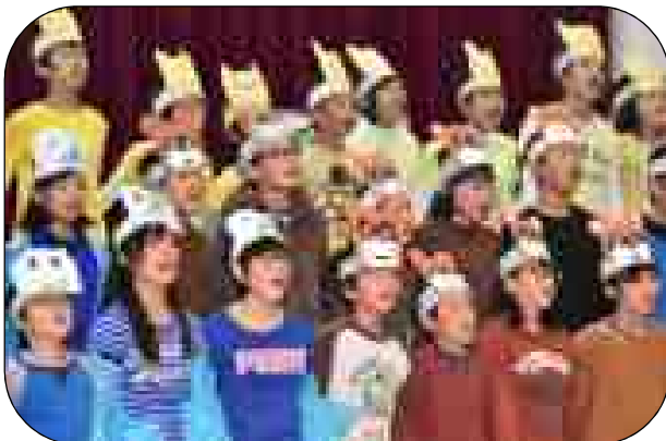
6年 劇「夢を売るきつね」

「がくしゅうはつびょうかい」 一ねん さの まなか 一ねんせいとは、「げんきいっぱい いなかよし一ねんせい」をしまし た。わたしは、はちやくをしまし た。おきやくさんが、いっぱいみ ていてきんちようしたけどがんば りました。うたも、かしをまちが えないでうたえてよかったです。 「せかいがひとつになるまで」も うたえてよかったです。 三ねんせいのえいごがすごかっ たです。えいごをいえてすごいと おもいました。