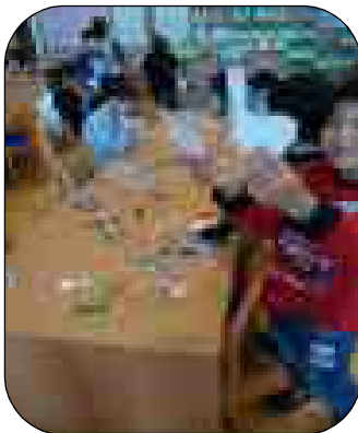
スタンプ（本を借りるともらえる）がたまり、「しおり」がプレゼントされ、大喜びでした

図書委員会が主催し、読書まつりが行われました。読書まつり期間は、図書委員による「読み聞かせ」「かるた大会」「必読書クイズ」「スタンプラリー」と、読書への関心を高めてもらう多彩な企画が行われました。図書委員のがんばりで、中間休みは図書室が大賑わいでした。