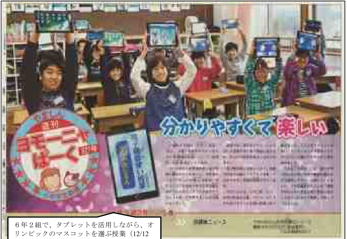
6年2組で、タブレットを活用しながら、オリンピックのマスコットを選ぶ授業（12/12の山形新聞に掲載）のようすです。