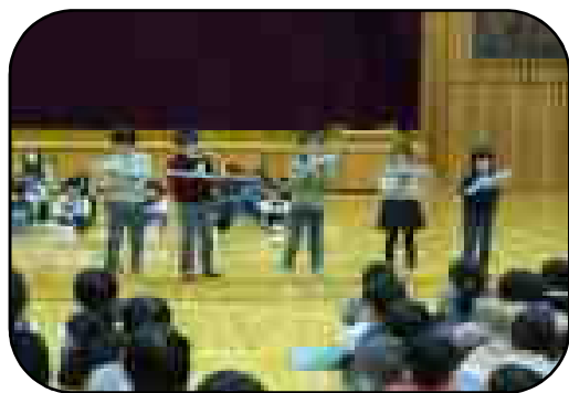
1年生が上手に発表できました

来年度入学する園児(59名)の新入生一日入学が行われ、1年生が学校の勉強を紹介しました。国語では詩の音読、音楽は「きらきらぼし」の演奏、算数は本よみけいさん、体育は縄とびとと跳び箱を上手に発表し、新入生もその様子に見入っていました。また、教室では、